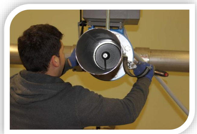
Rückansicht des Stop Silent AS54