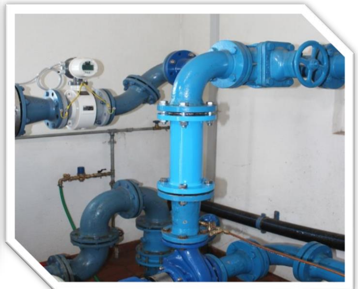
Zwischenflanschmontage des Stop Silent Ventils